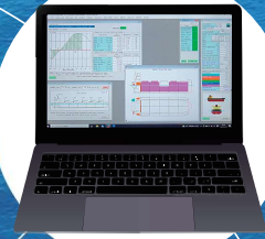
Cargo Loading System