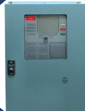
Marine Fire Detection System

日本船用エレクトロニクス株式会社 NIPPON HAKUYO electronics, Ltd.