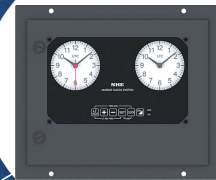
Marine Master Clock