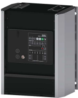
Public Addressing System